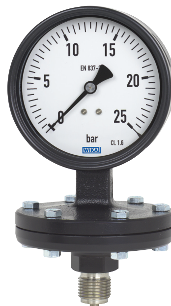
Манометр с пластиначатой пружиной Модель 422.12